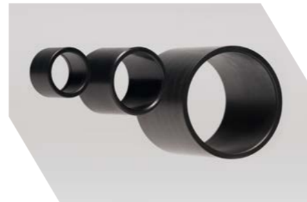
가정용기기 회전자 샤프트 부상