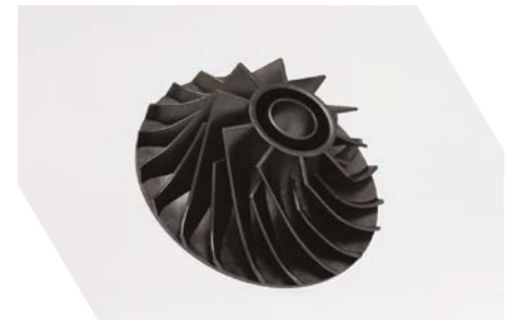
진공 청소기 흡입기/송풍기 임펠러

환경 친화성 연간 148kg의 CO2 배출을 저감. 38그루의 나무를 심는 것과 동일한 효과.