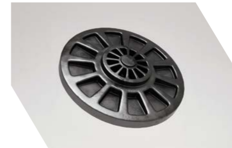
냉장고/AC 압축기 배출 밸브

최대 2%까지 에너지 효율성 향상 중량을 줄이고 공간을 더욱 효과적으로 활용.